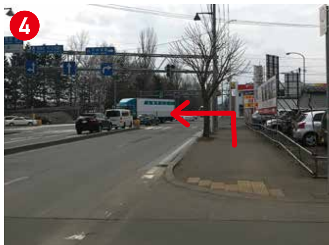
信号機付き交差点を、左(札幌ドーム側)に渡ってください。