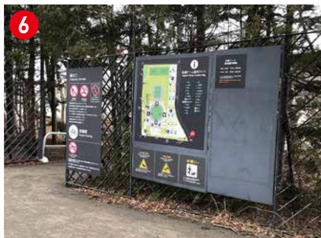
約50m進むと、札幌ドーム福住口(アウェイサポーター開門前待機列エリア)に到着です。