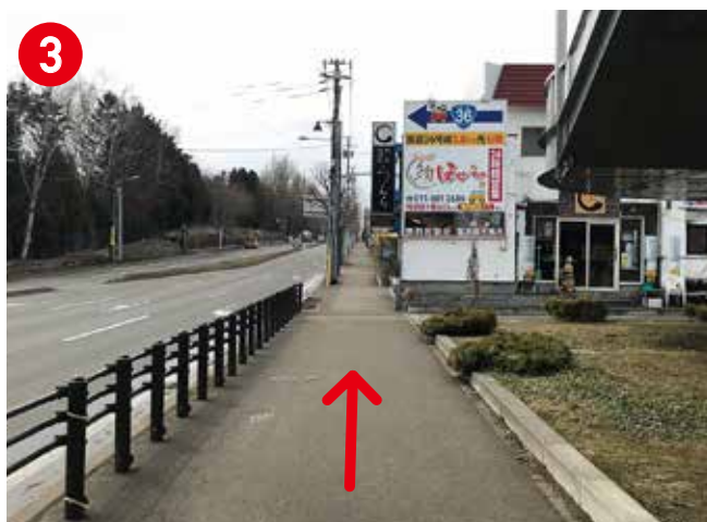
道路沿いに真っ直ぐ進んでください。※約600m (左側には札幌ドームが見えます)