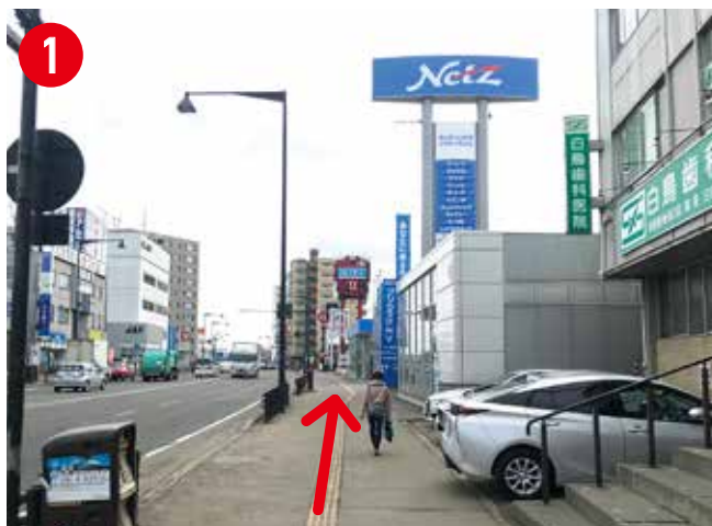
地下鉄東豊線「福住駅」3番出口から地上に出て、右へ真っ直ぐ進んでください。※約600m