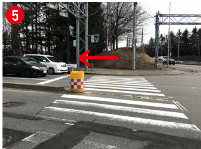
横断歩道を渡った後、左に曲がってください。